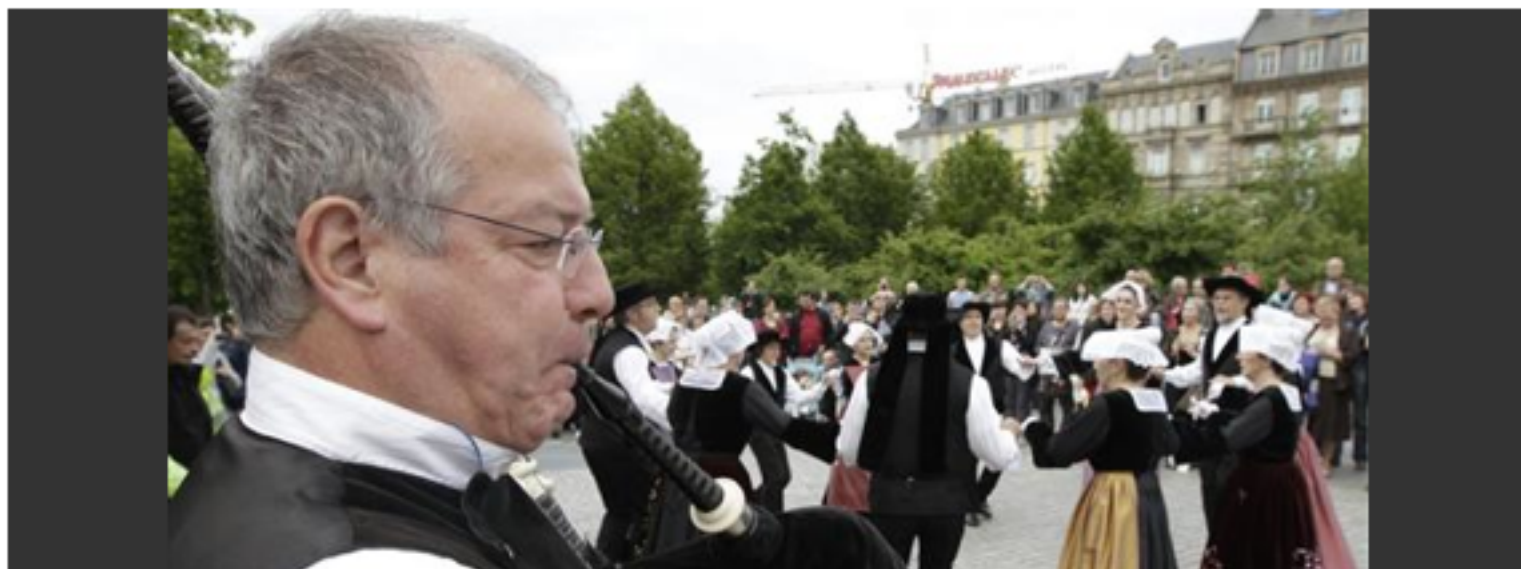
L'aubade donnée hier par le Bagad Pariz Ti ar Vretoned, place de la gare à Strasbourg.